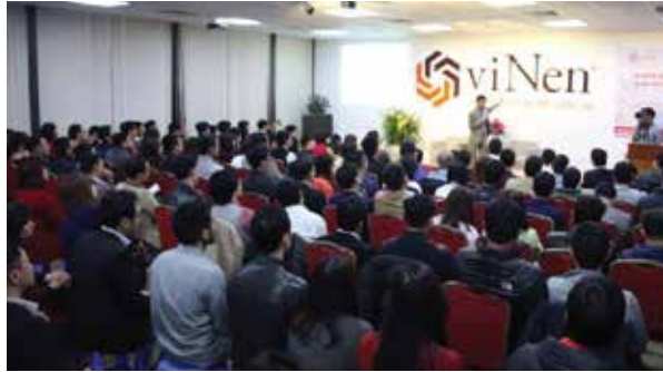
Hàng nghìn lượt lãnh đạo doanh nghiệp đã tham dự 168 chương trình Cafethunam (tính đến tháng 7 năm 2021)

K hởi nghiệp là công cuộc. Doanh nhân khởi nghiệp là người không biết mệt mỏi, không biết thỏa mãn giấc mơ. Con đường này khép lại, một chặng đường mới mở ra chờ đón họ chinh phục. Họ luôn là hiện thân, là linh hồn, là trái tim hòa nhập cùng nhịp đập của tổ chức để lan tỏa, để kết nối cùng hàng vạn trái tim khác trong một bản giao hưởng mang đầy chất sử thi và anh hùng ca, đó là những trái tim của tinh thần khởi nghiệp kinh doanh - trái tim của những doanh nhân.