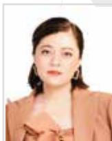
THS.TRƯỞNG LÝ HOÀNG PHI Ủy viên Ban Thường vụ