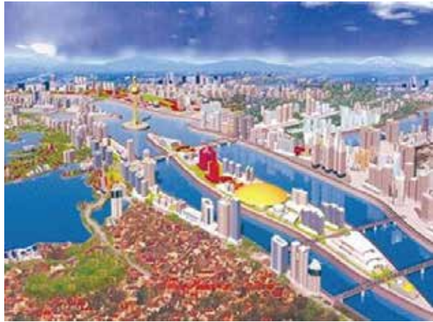
Hình ảnh thiết kế Không gian Khởi nghiệp Quốc gia (VINEN - ON) mang hình ảnh "Con tàu Khởi nghiệp" tại bãi giữa Sông Hồng.

Với kế hoạch xây dựng và vận hành các Không gian Khởi nghiệp Quốc gia từ Trung ương đến các địa phương với tên là VINEN - ON thể hiện sức sống mãnh liệt của tinh thần khởi nghiệp Việt Nam. VINEN - ON sẽ là nơi những người có khát vọng khởi nghiệp và sáng lập doanh nghiệp Việt Nam chia sẻ và kết nối cung cầu tri thức, kinh nghiệm, sản phẩm. Với Không gian VINEN - ON trung ương thì mỗi tỉnh, thành phố sẽ có một không gian riêng để trưng bày những sản phẩm của quê hương mình. Ở VINEN - ON địa phương dành cho từng huyện, thị trấn trưng bày những sản phẩm của địa phương.