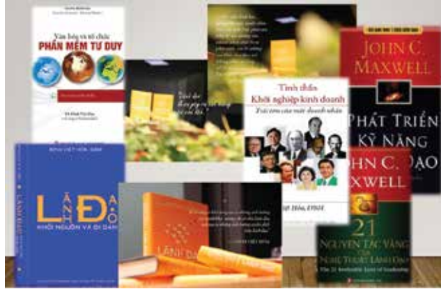
Những đầu sách nổi tiếng do TS. Đinh Việt Hòa viết và dịch

Phó Giáo sư Đại học Capitol Chủ tịch Sáng lập