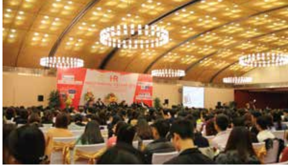
Hàng nghìn lãnh đạo doanh nghiệp đã tham dự Ngày nhân sự Việt Nam 2016